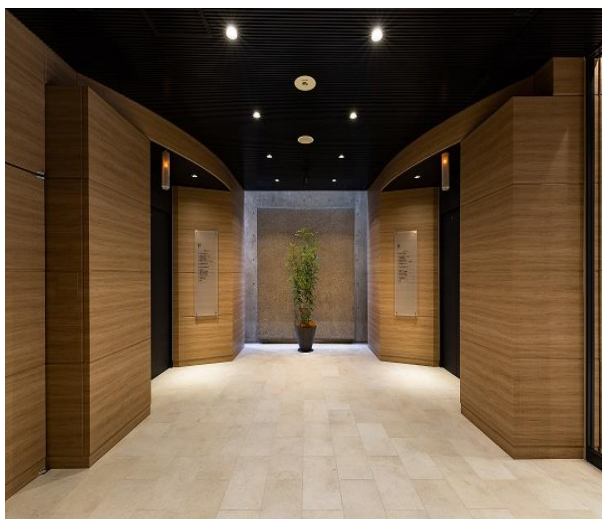
1階エレベーターホール（2018年リニューアル）