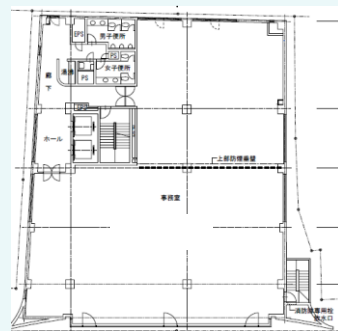
8階 181.43㎡ (54.89坪)