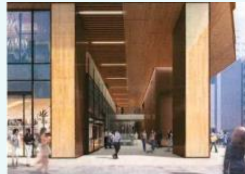
1階ピロティ イメージ