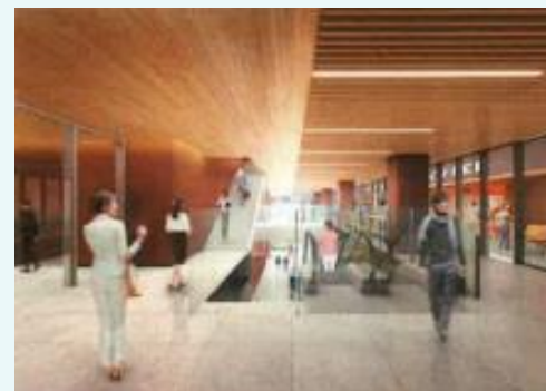
2階テラス イメージ