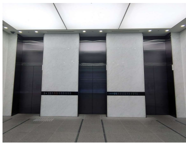
1階 エレベーターホール