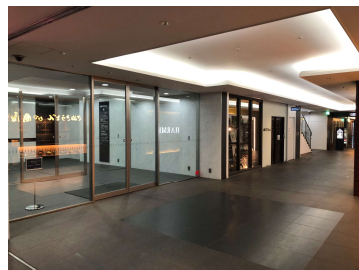
地下街直結の地下1階出入口