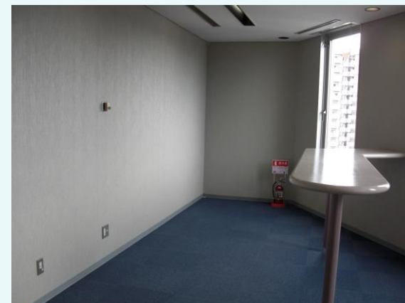
リフレッシュコーナー