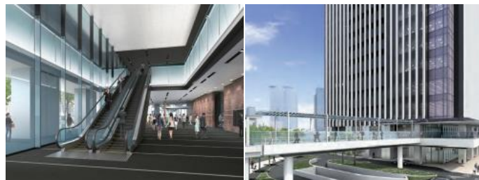
1F エントランスホール