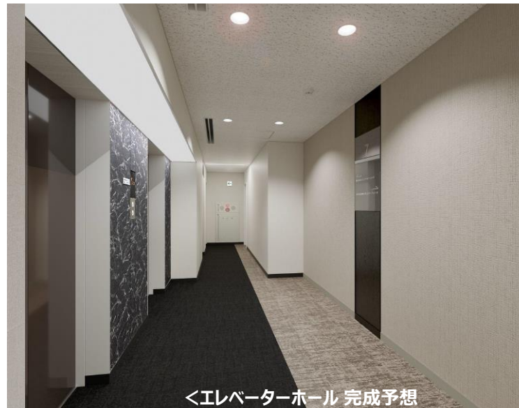
<エレベーターホール 完成予想>