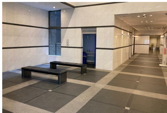
ロビー及びエレベーターホール