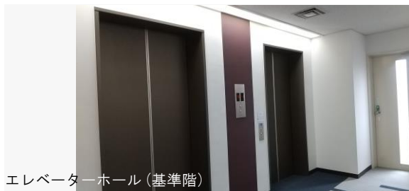
エレベーターホール (基準階)