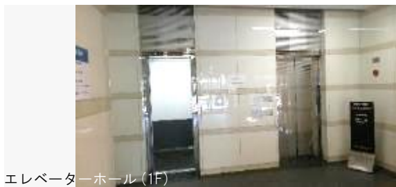
エレベーターホール (1F)