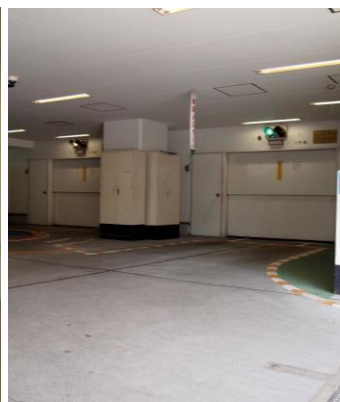
タワーパーキング