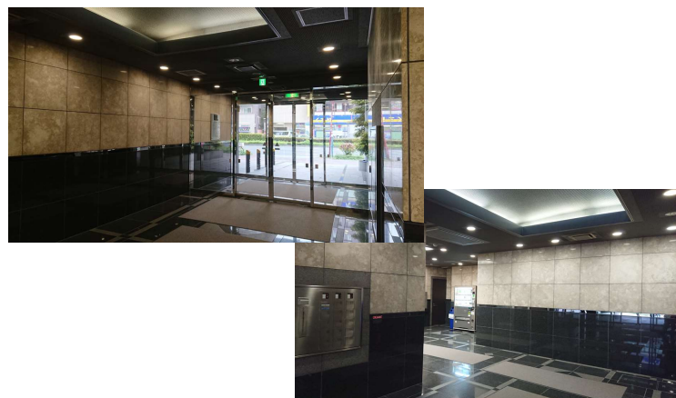
エントランス・エレベーターホール