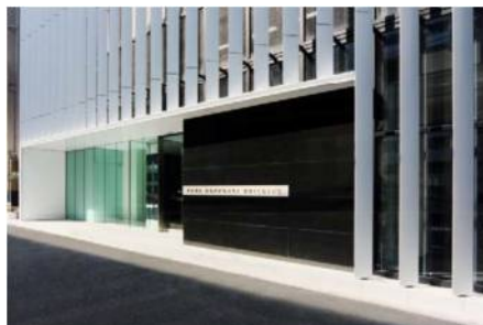
エントランス外観