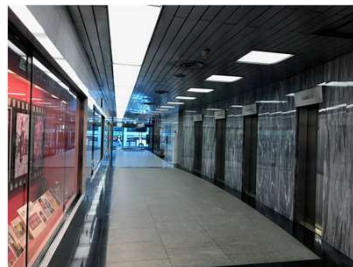
エレベーターホール