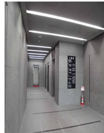
エレベータホール