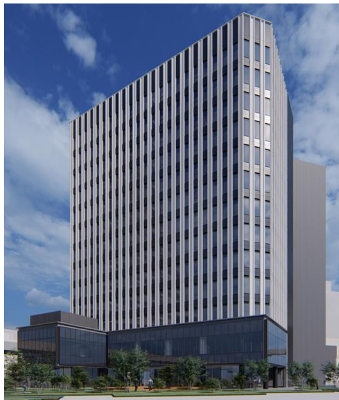
北西側外観イメージ