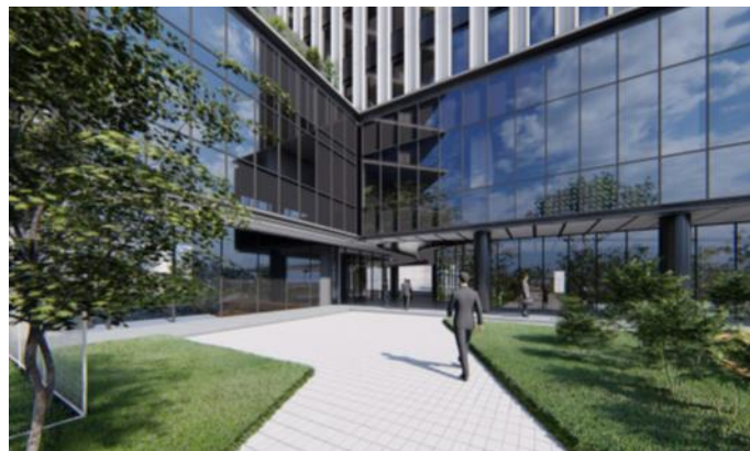
エントランスイメージ