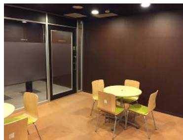
リフレッシュルーム