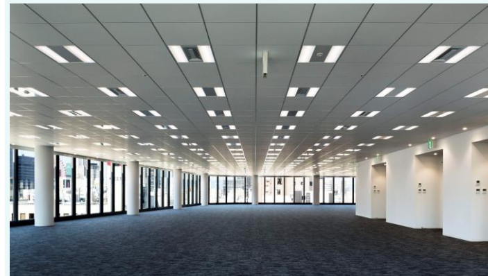
基準階(天高2,800mm、グリッド天井)