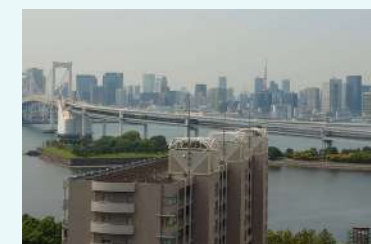
貸室内からの眺望