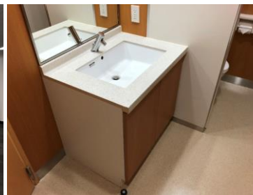
室内トイレ・洗面台