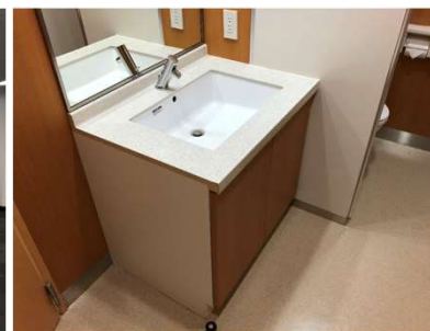
室内トイレ・洗面台