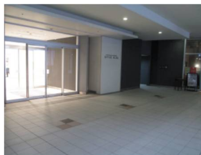
商業ゾーン共用部