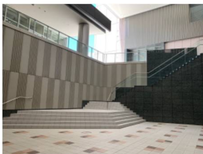
商業ゾーンアトリウム