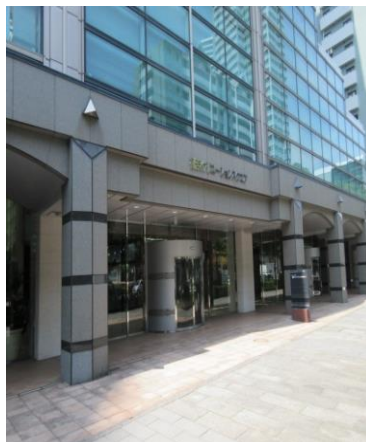
1階エントランス付近