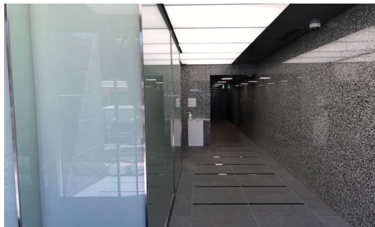
エントランス・エレベーターホール