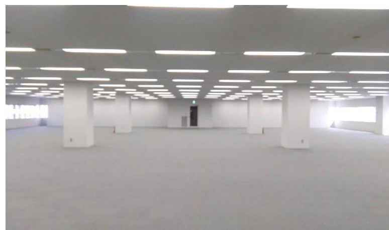
基準階空室イメージ (1フロア)