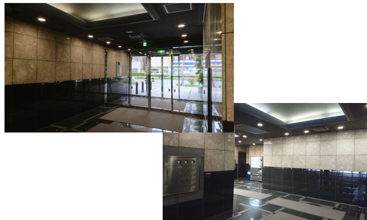
エントランス・エレベーターホール