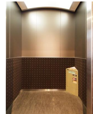
エレベーター籠内