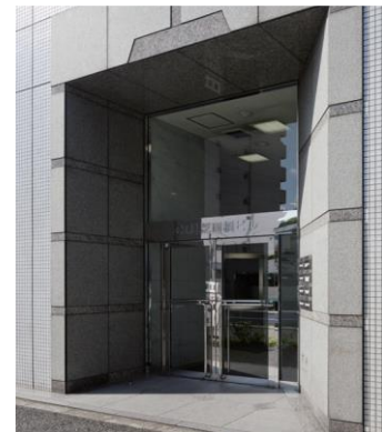
1階 エントランス入口