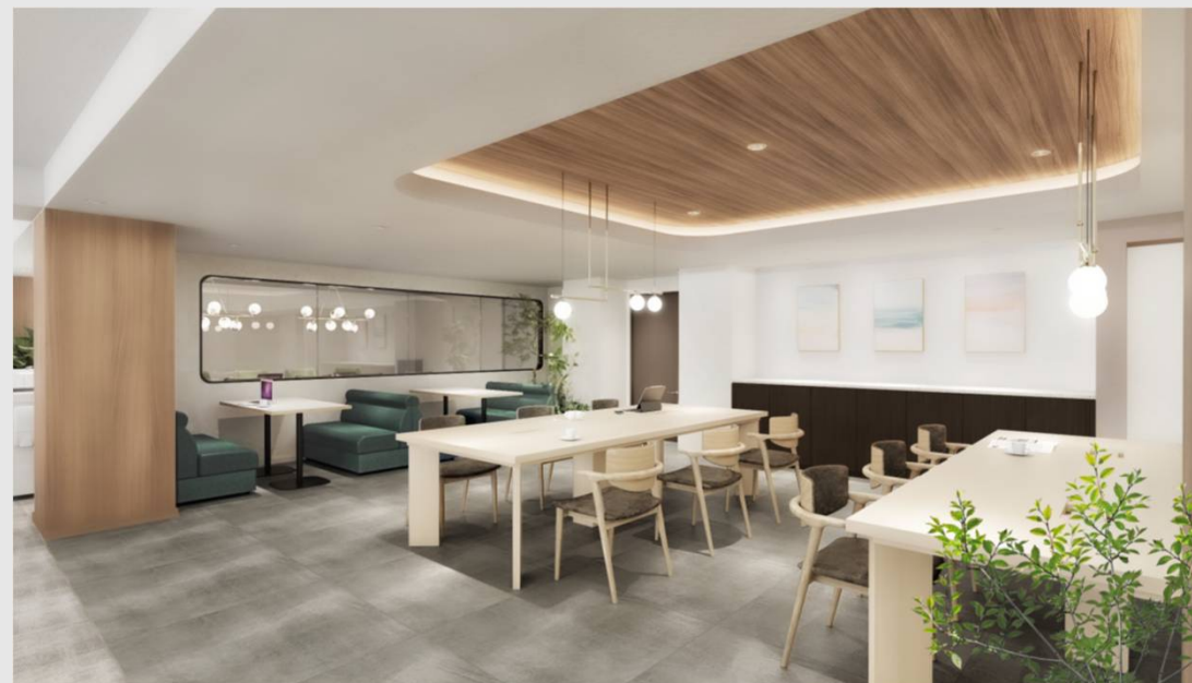
C_執務室 (植栽・什器付き)