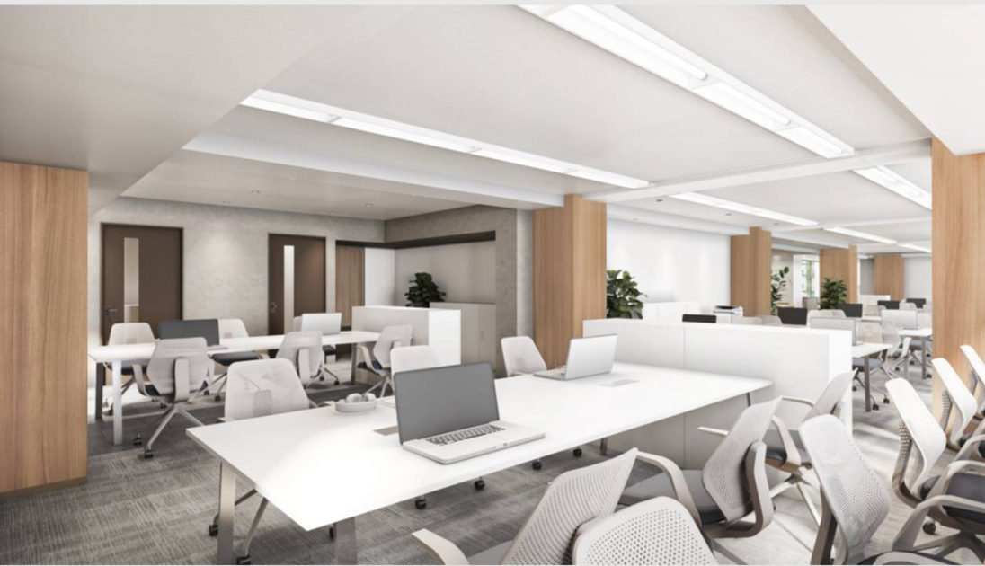
D__執務室（什器なし）※パースはイメージです