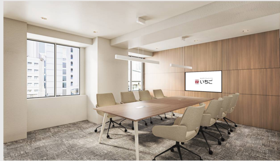
A_社内用会議室 (什器付き)