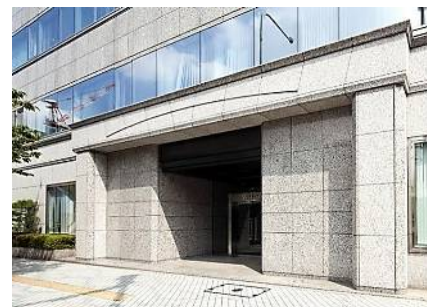
建物エントランス