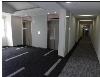
各階エレベータホール