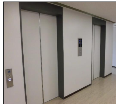
各階エレベーターホール