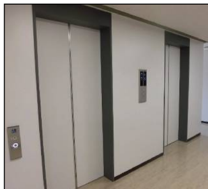
各階エレベーターホール