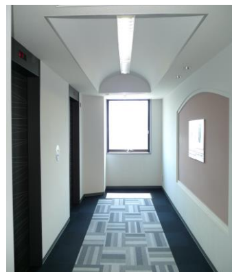
各階エレベーターホール