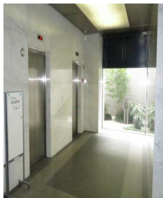
1階エレベーターホール