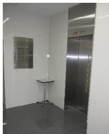
1階エレベーターホール