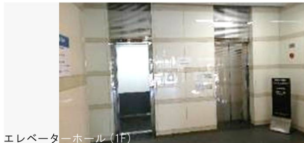
エレベーターホール (1F)