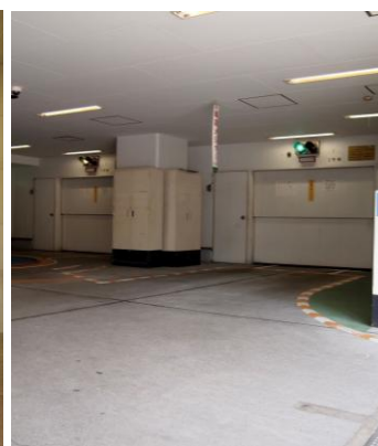
タワーパーキング