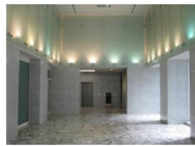
1階エントランスホール