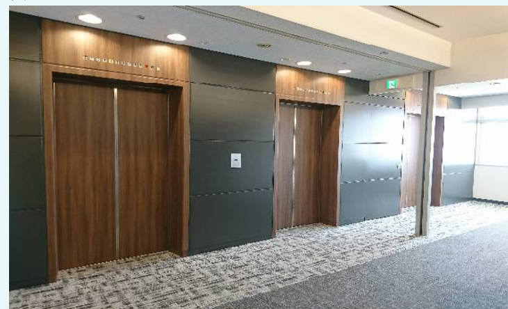
基準階エレベーターホール